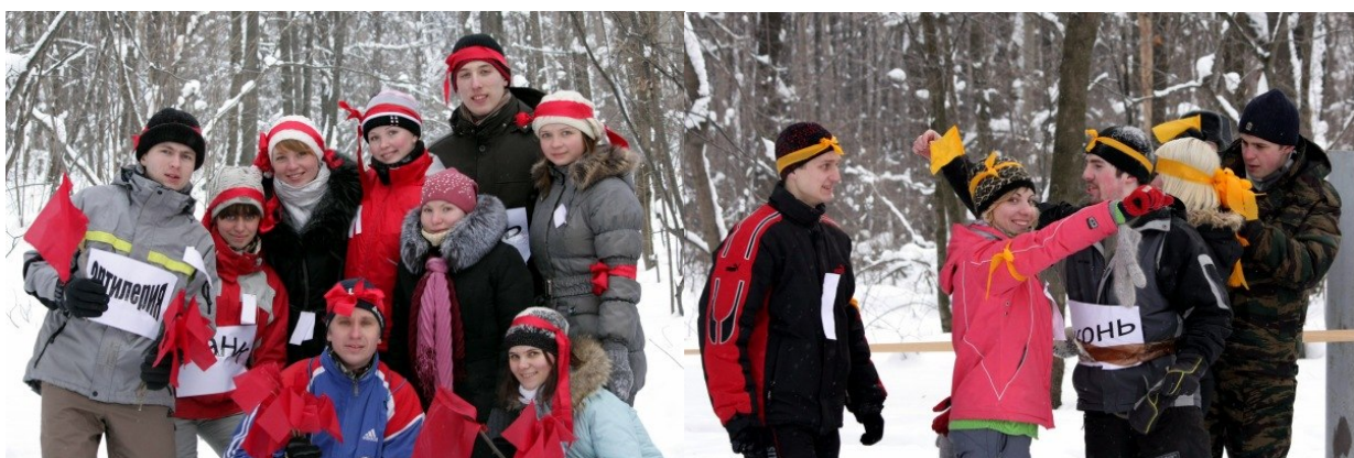
Начало военного конфликта между командами (Разделение по командам)

По итогам игры была создана группа для обсуждения и обмена мнениями ребят – участников http://vk.com/event23572095